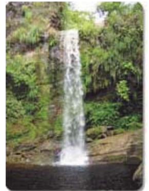
Imágenes del P.N. Kaa-Iya, Bolivia, donde desarrollamos nuestro primer proyecto internacional.

Este proyecto supone el diseño y adecuación de un sendero interpretativo en el área de amortiguamiento del Parque Nacional, con fines de educación ambiental y promoción ecoturística del área. En ambas etapas, diseño y adecuación, jugará un papel fundamental la comunidad local, que se responsabilizará de la gestión para el uso público del sendero. Serán asesorados por la Capitanía del Alto y Bajo Isoso (CABI), organización de base local y con competencias en la gestión de este espacio natural protegido.