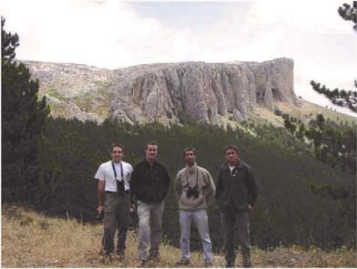
En el Parque Natural del Moncayo

A lo largo de 2004 se establecieron varios contactos con diferentes entidades para la realización de futuros proyectos desde Territorios Vivos (en trámites):