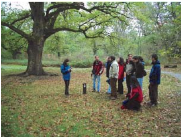
Territorios Vivos en el Robledal de Orgi (Navarra)

Nacida gracias al interés e iniciativa de un amplio grupo de personas especializadas en el ámbito de los espacios protegidos, Territorios Vivos representa una plataforma de trabajo de carácter transdisciplinar, coherente y comprometida con sus objetivos, cuyo trabajo se basa en el conocimiento científico y la interacción continua con todos los agentes sociales involucrados.