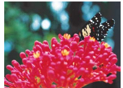
Territorios Vivos es una asociación de carácter internacional.

Mediante nuestros socios en América Latina pretendemos reforzar nuestra presencia en la región a través de proyectos de cooperación con contrapartes locales. Ya hemos desarrollado nuestro primer proyecto en el Parque Nacional Kaa Iya en Bolivia, donde seguiremos trabajando este 2006, y hemos comenzado a trabajar en Chile y México, donde se ha registrado Territorios Vivos México a iniciativa de uno de nuestros socios y va a comenzar a desarrollar sus proyectos, Próximamente también se trabajará con Argentina.